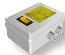
Quadro elettrico QMIT